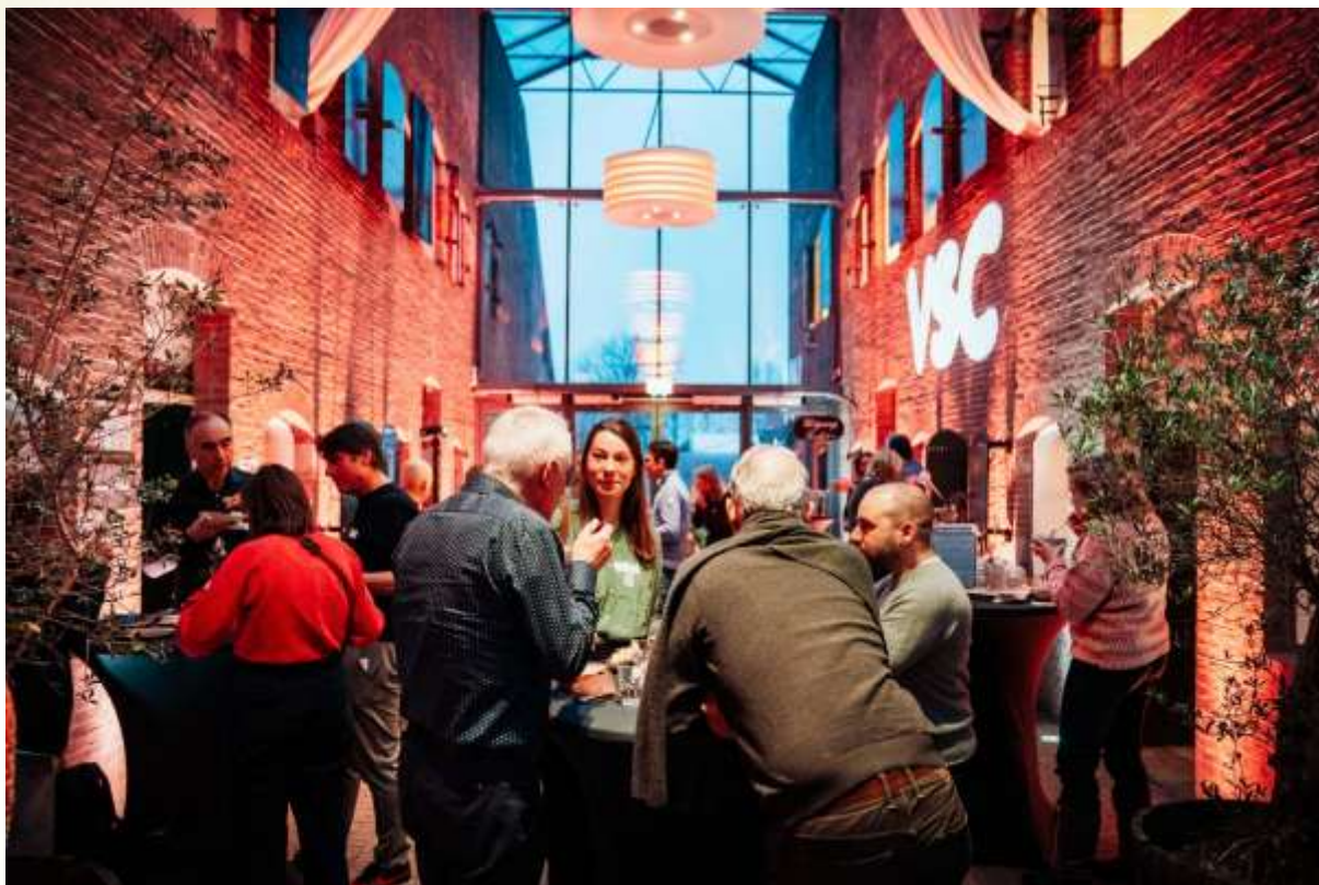
VSC-jubileumdag bij GeoFort

De VSC ontvangt voor haar activiteiten, in aanvulling op de deelnemersbijdrage van de leden, jaarlijks subsidie van het ministerie van OCW en voor collectieve VSC-projecten ondersteuning van het bijvoorbeeld het Mondriaan Fonds, Cultuurfonds, Fonds voor Cultuurparticipatie, ASML en het Ministerie van EZK en LNV.