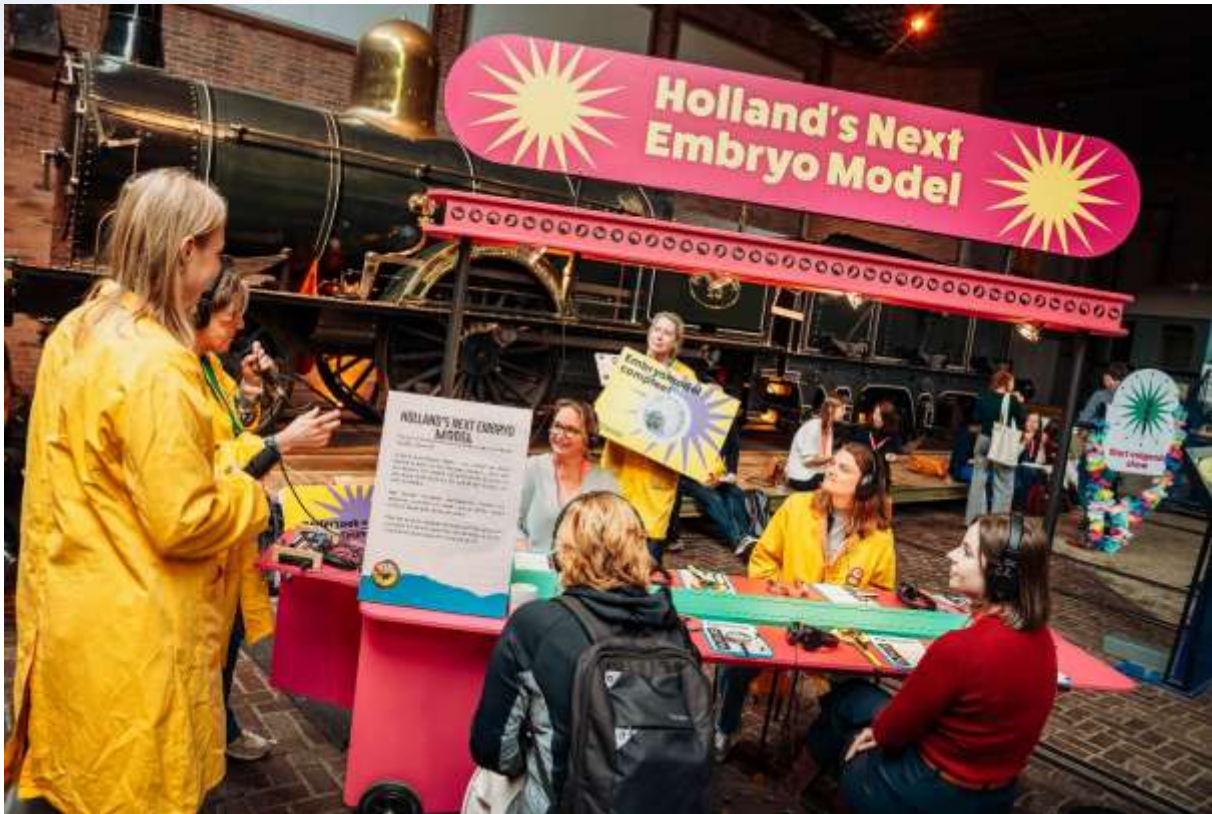
Holland's Next Embryo Model op de Nationale Wetenschapscommunicatiedag in het Spoorwegmuseum.

In landen om ons heen worden wetenschapsmusea en science centers gezien als natuurlijk partners voor kennis- en onderwijsinstellingen. In Nederland is er ondanks alle inspanningen nog steeds sprake van onderscheid. In samenwerking met NEWS, NWO, KNAW, UNL en anderen is het streven dat VSC en onze leden meer worden gezien als natuurlijke partners voor outreach, wetenschapscommunicatie en -educatie, citizen science, dialoog en interventies.